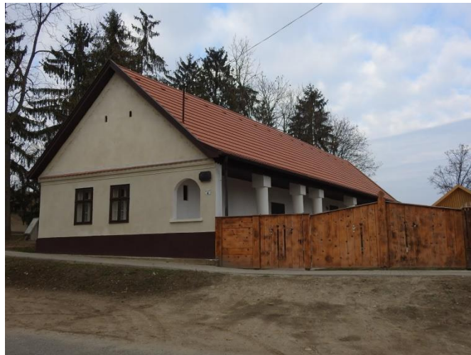
A Gombai Tájház

A napot egy visszatekintő beszélgetés zárja le, ahol játékos formában számot adnak az adott napon tanultakról. Célunk olyan élményközpontú programok szervezése, melyek lehetőséget kínálnak a 3.-5. osztályos tanulók és a pedagógusok számára a magyar és a gombai néphagyományokon keresztül megismerni és kipróbálni, megtanulni szokásaink egy-egy fontos részét. A témanapok szakmai célja az iskolai nevelés programjának támogatása hagyományismereti foglalkozásokkal, gyakorlati kompetenciák elsajátításának elősegítése gyakorlati kézműves foglalkozásokkal, a magyar kultúra hagyományainak megismertetése, népzenei és néptánc produkciók megtanítása, a magyar hagyományok és népi kultúra megszerettetése a korosztállyal.